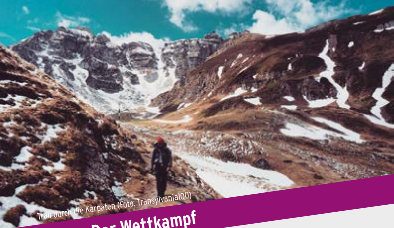
Trail durch die Karpaten