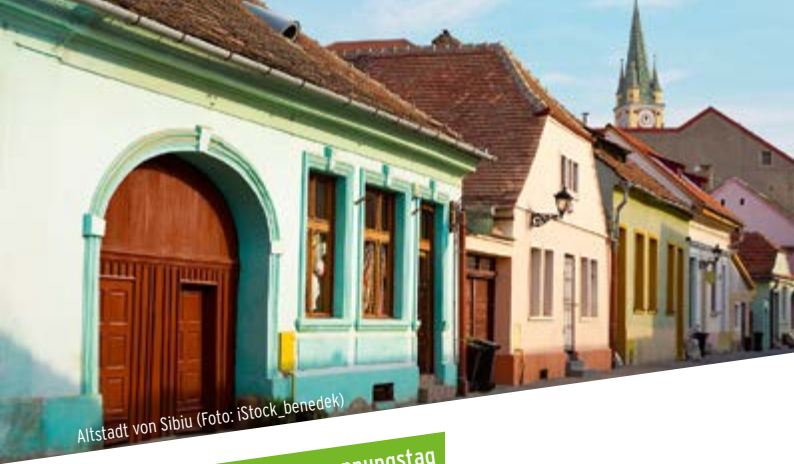
Altstadt von Sibiu